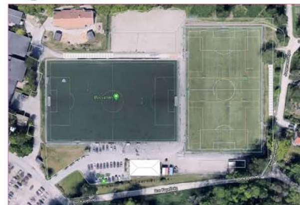
1 Flygfoto 1 : 2000